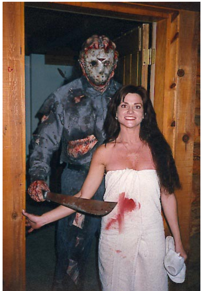
Maman, je te présente mon nouveau boyfriend